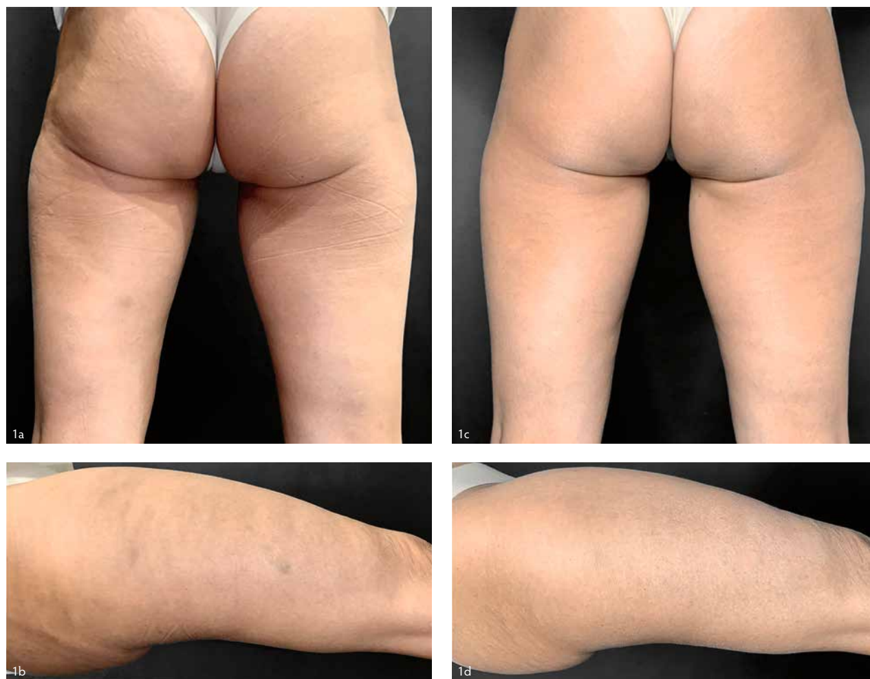
Фото 1. Пациент — женщина, 46 лет. А–б — до процедур, с–д — через 42 дня