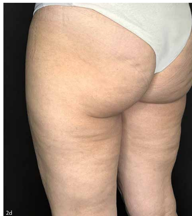
Фото 2. Пациент — женщина, 44 года. А–b — до процедур, с–d — через 28 дней

При осмотре: видимая III стадия фиброзного целлюлита, кожа бледная, на ощупь прохладная, тонус снижен, признаки неровности кожи определяются в покое без напряжения мышц и изменения положения тела.