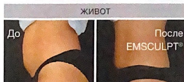
4 недели после 4 процедур EMSCULPT®.