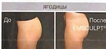
4 недели после 4 процедур EMSCULPT®. Из практики д-ра Санила Чулукури.

Бол. Предтеченский пер. 14, м. Баррикадная